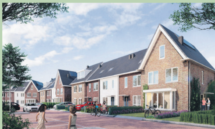
Impressie eengezinswoningen (type Waterhyacint) in nieuwbouwproject Watertuinen (Maasdijk).

De rijwoning van het type Watermunt is een compacte woning voor startende gezinnen. De begane grond heeft een woonkamer met standaard een open keuken. De tuin is diep genoeg voor een uitbouw. Meer woon-