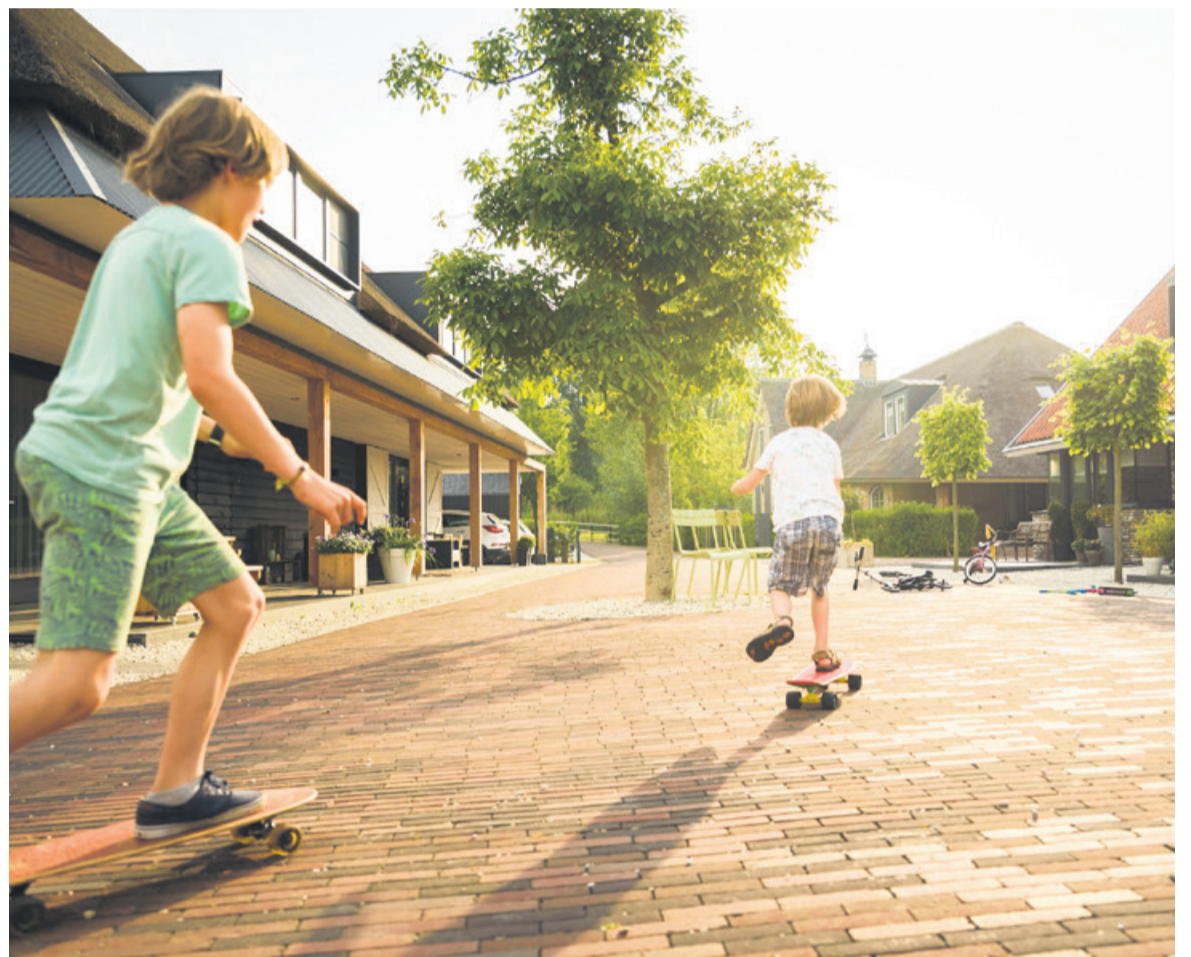
Wilgenrijk: ruimte voor ontspanning.