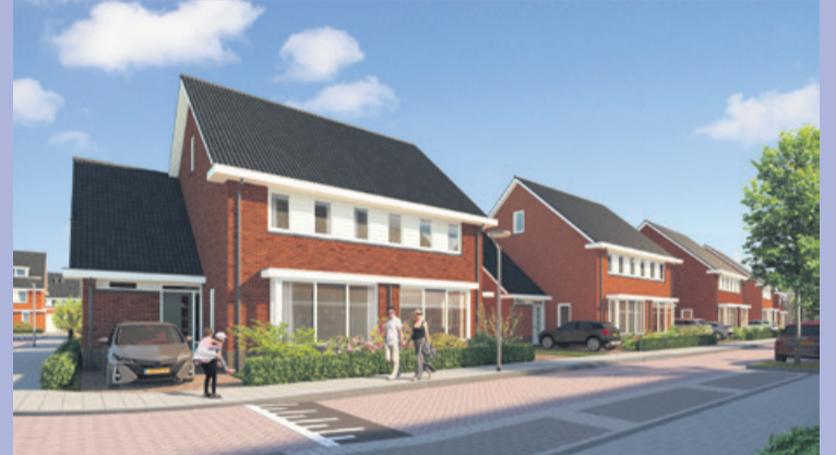
Impressie twee-onder-een-kap woningen Parc Hooglande (Naaldwijk).

Fraaie nieuwbouwwoningen in een kindvriendelijke buurt, met leuke speelplekken. Je vindt ze in nieuwbouwproject Parc Hooglande, in de wijk Hoogeland in Naaldwijk. De verkoop van fase 2 is onlangs gestart. Deze fase krijgt 36 rijwoningen en 24 twee-onder-een-kap woningen met de architectuur van de jaren dertig.