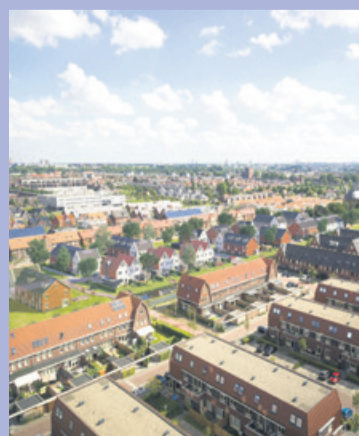
Fotobewerking nieuwbouwproject Juliahof/Julia's Eiland (Wateringen).